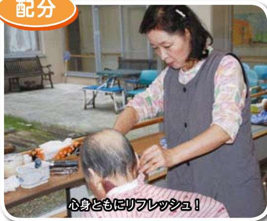
心身ともにリフレッシュ!