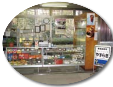
軽食、お菓子、仏具も取り扱っています

どうぞご理解の上、「セレ・ショップやすらぎ」をご利用いただけますようお願いいたします。