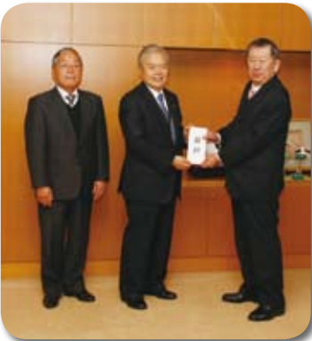
草の根活動を続けて32年

平成22年には、永年にわたる活動に対し、共同募金運動優良団体として、厚生労働大臣表彰を受賞されました。