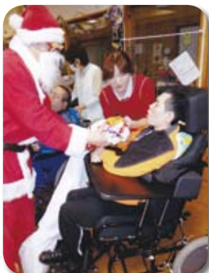
今年のプレゼントは何かな？