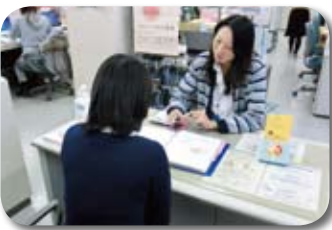
子育てに関する相談はお気軽に