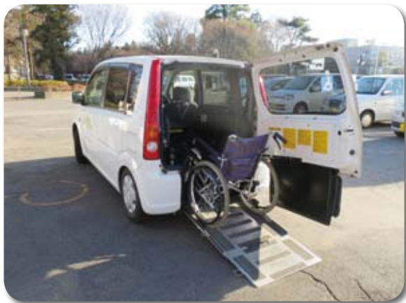
通院、行楽等に便利な「たんぼぼ号」