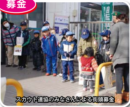
スカウト連協のみなさんによる街頭募金

12月の1ヶ月間「歳末たすけあい運動」を実施したところ、市民のみならずまからの温かいご協力をいただき、ありがとうございます。 厳しい経済状況の中、歳末たすけあい募金総額は、409万3千798円となりました。 あらためて、お礼申し上げます。 お寄せいただいた募金は、準要保護世帯などの支援を必要とする方々(309世帯・851人)に「歳末見舞」として街の活性化にもつながるよう市内共通商品券(NOX)の配布をします。