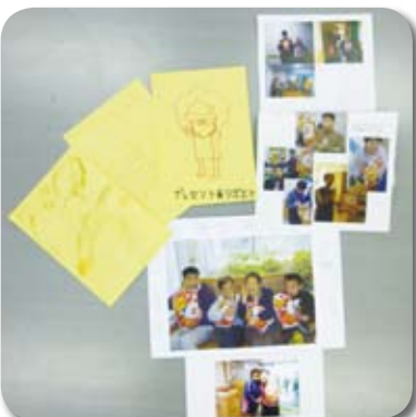
利用者さん直筆のありがとうメッセージ