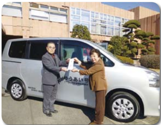
乗りやすいミニバンタイプの車輛です

ご厚意に対し、厚く感謝申し上げますとともに、社会福祉協議会の円滑な事業運営を図るため、有効に活用させていただきます。