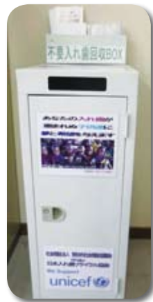
価値ある資源として、再活用できます

野田市社会福祉協議会では、不要になった入れ歯を回収しています。入れ歯や虫歯治療で削った歯の上部にかぶせる「クラウン」などには、金、銀、パラジウムといったレアメタル(希少金属)が使われており、これをリサイクルする活動です。 長く使ったものでも、価値ある資源として利用できます。 〔収集方法〕 熱湯または洗剤で消毒し、ビニール袋に入れて野田市社会福祉協議会事務局