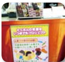
3ヶ月毎に寄贈いただいています

パチンコ店チャレンジャーを運営する株日本総合開発では、「たくさんの笑顔をいつまでもプロシエクト」と題した企画で、カウンターに収集箱を設置し、集まったお菓子を社会福祉協議会を通じて、福祉施設へ寄付しています。