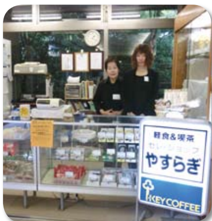
飲み物、軽食、お菓子、仏具を取り扱っています