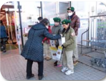
スカウト連協のみなさんによる街頭募金