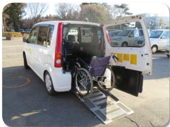
軽自動車なので小回りが利いて便利です