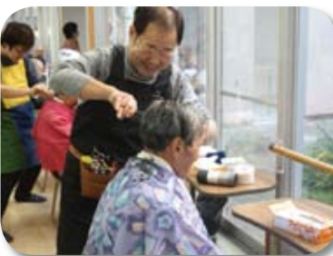
会話も楽しみの一つです 〔訪問理美容サービス〕