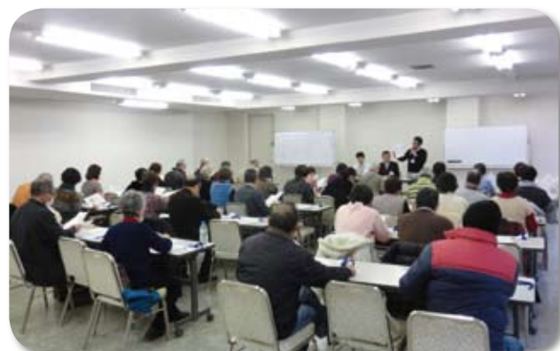
説明会では制度の内容について詳しく説明します

なお、野田市社会福祉協議会では、野田市ボランティアセンターの運営も行っておりますが、ボランティアセンターの登録と本制度の登録は異なるものですので、ご注意ください。 【問合せ】 制度・受入施設について 野田市保健福祉部高齢者福祉課 ☎7125-1111 (内線2971) ボランティア活動について 野田市社会福祉協議会 ☎7124-3939