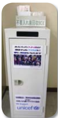
価値ある資源として、再活用できます