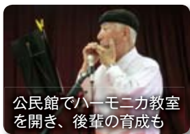
公民館でハーモニカ教室を開き、後輩の育成も