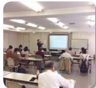
関心の高い市民後見人養成講座

このような状況を踏まえ、判断能力が低下しても地域で安心して生活していくためには、日常生活自立支援事業から成年後見制度へ途切れることなく支援していくことや低所得で身寄りのない方に対する支援が必要であると考え、平成29年1月から野田市成年後見支援センターを開設し、法人後見を開始すべく準備を進めています。