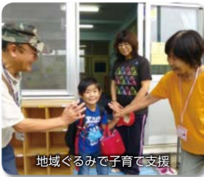
地域ぐるみで子育て支援