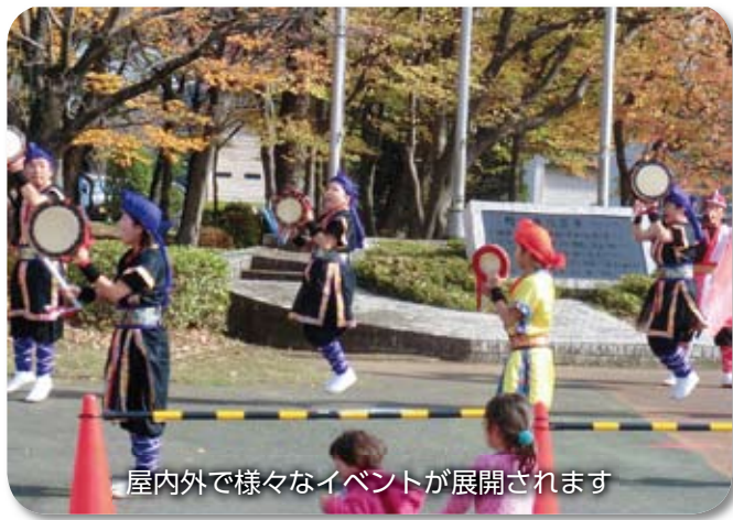
屋内外で様々なイベントが展開されます

文化会館ロビーでは、福祉のまちづくりフェスティバルも同時開催され、恒例のスタンプリー(景品あり)も実施されます。