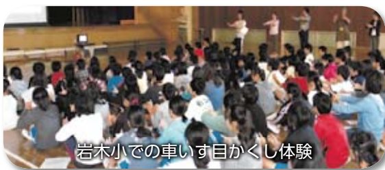
岩木小での車いす目かくし体験

地域の住民のみならず、手をとって支えあう「あったかい地域づくり」を目指しています。