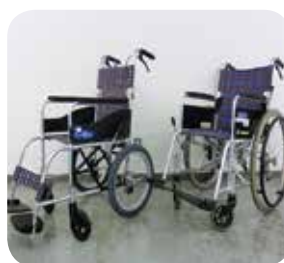
貸出状況はお問合せを