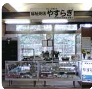
飲み物、軽食、お菓子、仏具を取り扱っています

ことが福祉の輪を広げることにつながります。ぜひ、「セレ・ショップやすらぎ」をご利用ください。 【問合せ】 斎場売店直通 ☎7122・4017