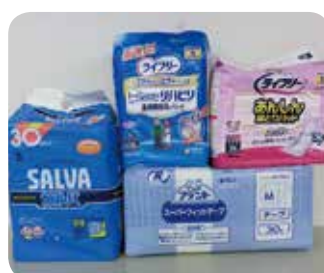
寄付の受け入れも受付しています（新品未開封に限ります）