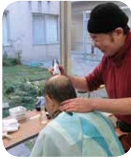
心も身体もスッキリ！ 訪問理美容サービス

当協議会では、「ふれあいと支えあい、福祉の心豊かなまちづくり」を基本理念として、地域社会全体で問題解決に取り組む、市民が自立し安心して暮らせる心豊かな福祉社会の実現を目指し、各種事業に取り組んでいきます。