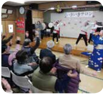
いきいきと体操を楽しんで健康に

り、北部学童保育所が、北部小学校の隣接地に新設された施設へ移設され、岩木第2学童保育所の保育室が増設されたことに伴い定員数が増加されたことや、平成30年4月1日より南部学童保育所を新たに受託するなど、学童保育所の円滑な運営に努めました。事業を推進するためには、財源確保は非常に重要であることから、会員会費、共同募金などが地域福祉を推進するための貴重な財源であることの理解を深めるため、事業活動や広報活動を通して市民への周知に努めるとともに、事務経費の削減、職員の資質向上を図るための人材育成など、経営の充実に努めてきました。