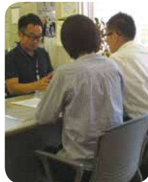
お気軽にご相談ください