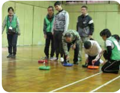
手をつなぐ親の会と共催している「じょいんと」

野田市社会福祉協議会では、「ふれあいと支えあい、福祉の心豊かなまちづくり」を基本理念とした野田市地域福祉活動計画(第2次改訂版)実施計画に基づき、地域社会全体で問題解決に取り組み、市民が自立し、安心して暮らせる心豊かな福祉社会の実現を目指し、各事業の推進に努めました。