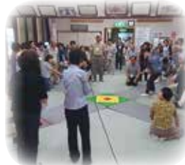
交流が広がるふれあいの会

また、社協職員の意識高揚能力開発などによる人材育成に努めるとともに、職員が意欲を持っていきいきと働くことができる組織づくりを進め、常に課題意識を持ち、事務事業の目的に沿って自ら考え行動できる職員の育成に努め、今後の社会情勢の変化や地域のニーズなどを注視しながら、当協議会の果たすべき地域福祉の役割を進めていきます。