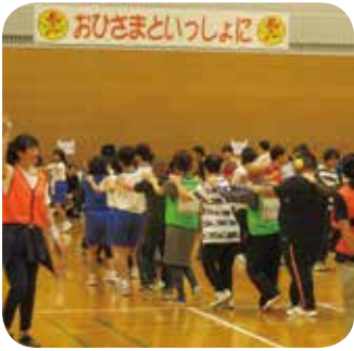
盛り上がったじゃんけん列車

開催を控えた東京パラリンピックの競技である、ゴールボール、シッティングバレーの用具展示等を行いました。約千人の来場者で賑わいました。