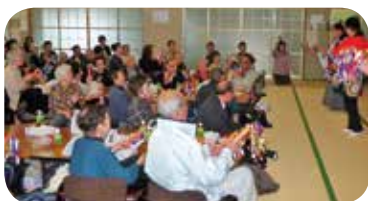
盛り上がったズンドコ節

理念とした活動に取り組んでおります。各自治会より選出いただいた「ボランティア会」の方々によるおひとり暮らしの方への「友愛訪問」や中根保育所での除草、せん定作業などの「ボランティア活動」。 また、年2回ふれあいの会を開催しております。 小学校児童によるおひとり暮らしの方への年賀状も喜ばれております。年2回発行の広報紙「なかね」は、平成最後の発行で第58号となりました。