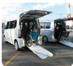
運転手は利用される方で確保をお願いします