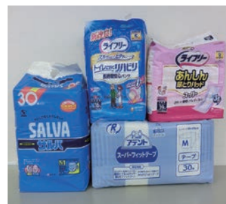
寄付の受付もしています （新品未開封に限ります）