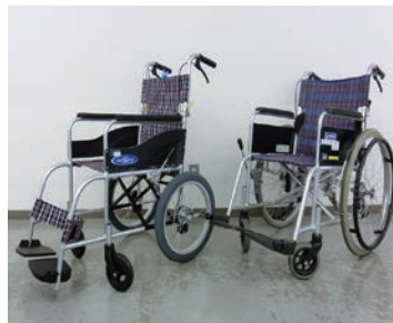
貸出状況はお問合せを

〔対象〕 高齢者・障がい者及び一時的なけがなどにより必要な方 〔利用料〕 無料（貸出期間中の故障は自己負担） 〔貸出期間〕 原則1か月（更新有）