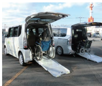
運転手は利用される方で確保をお願いします

〔対象〕 高齢者・障がい者（児）及びその家族 〔利用料〕 無料（燃料は自己負担） 〔貸出車両〕 ①「たんぼぼ号」（軽自動車） ②「ゆうあい号」（ワンボックス車） 《定員》 3名（車いす1台） 《定員》 5名（車いす2台）