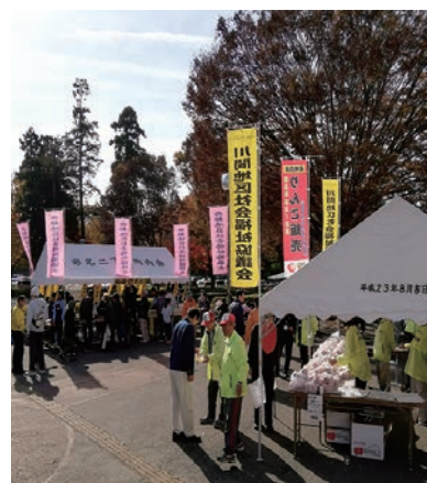
模擬店も多数出店

〔場所〕文化会館ロビー 勤労青少年ホーム体育室 〔問合せ〕福祉のまちづくり推進協議会事務局 生活支援課 ☎7125-1111