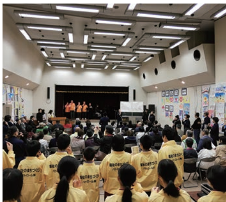
参加者みんなで手話コース

主な内容>> ②結婚50周年記念、エンディングノート、地区社協紹介 ③赤い羽根・歳末募金、会費協力のお願い ④ボランティア情報・ファミサポ ⑤貸出案内 ⑥寄せられた善意・まちがいがさし