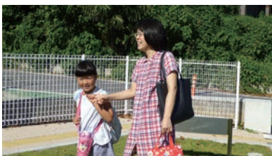
「地域の力」で子育てを支援

学童保育所、習い事の送迎や預かりといった、短時間の活動です。できる時にできる範囲で子育ての応援をしていただく方（提供会員）または両方会員として活躍してみませんか。