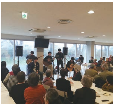
理科大生との交流はこの地区の特色

何よりも重視していることは、地区社協と地域住民をつなぐために、広報紙を年に4～5回全戸配布していることです。これからはあなただも一緒に！明日からはあなただも一緒に！