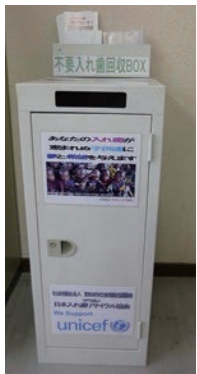
リサイクルで社会貢献も