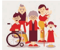
あなたの町の募金は、あなたの町のために使われています。 赤い羽根共同募金

戦後の荒廃が残る昭和22年に始まった赤い羽根共同募金は、みなさまに支えられ、今年で73回目を迎えます。