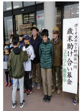
スカウト連協による街頭募金