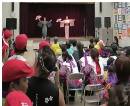
舞踊体操で大賑わいの会場

当日は天候にも恵まれて暖かく過ごしやすい1日となり、多くの方に来場いただき、各団体の発表を楽しまれました。