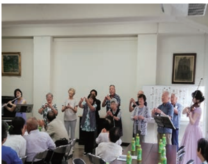
素敵な音色と地域の方の手話コースが共演（さわやかサロン）

また、スタッフの見聞を広めるため、障がいのある方の施設訪問を実施しています。課題をもって見直し、その人たちの立場にたって考えることができます。