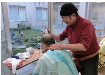
心身ともにすっきり訪問美容サービス

特別養護老人ホーム入所者に対する「訪問理美容サービス事業」も毎年ニーズが高く、合計11施設、736人（男163人・女573人）に実施しました。