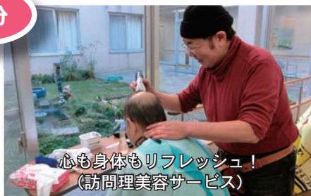
心も身体もリフレッシュ！ (訪問理美容サービス)

グサービス」の事業費として配分されます。 市内各地で、街頭募金活動も行われる予定です。みなさまのご協力をお願いします。