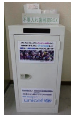
リサイクルで社会貢献も

〔使いみち〕 業者に送り、換金したお金の一部が（財）日本ユニセフ協会と社会福祉協議会に寄付され、地域福祉活動の資金として役立てられます。 ※金属が使われていない入れ歯は回収の対象となりません