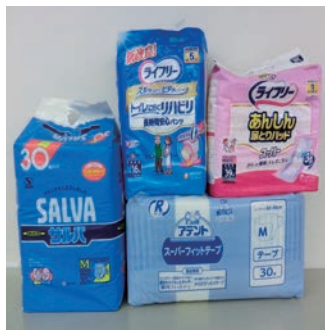
寄付の受付もしています (新品未開封に限ります)

〔配布人数〕 おむつ5名・パッド5名 〔応募先〕 〒278-0003 野田市鶴奉5-1 野田市社会福祉協議会 〔応募締切〕 11月27日（金）