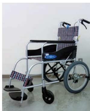
貸出状況はお問合せを

〔対象〕 高齢者・障がい者（児）及び一時的なけがなどにより必要な方 〔利用料〕 無料（貸出期間中の故障は自己負担） 〔貸出期間〕 原則1か月（更新可）