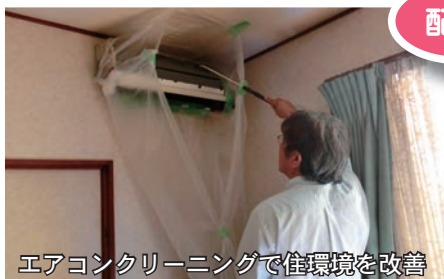
エアコンクリーニングで住環境を改善