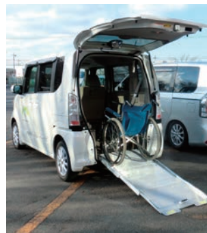
運転手は利用される方で確保をお願いします

〔対象〕 車いすを利用して移動する方及びその家族 〔利用料〕 無料（燃料は自己負担） 〔貸出車両〕 ①「たんぼぼ号」（軽自動車） 《定員》3名（車いす1台） ②「ゆうあい号」（ワンボックス車） 《定員》5名（車いす2台）