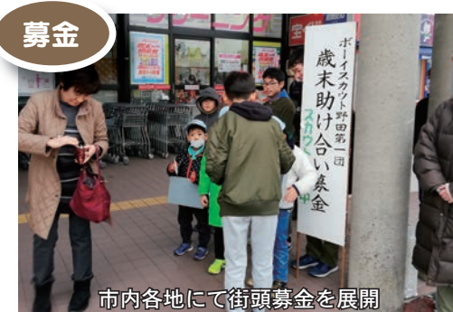
市内各地にて街頭募金を展開

3%以内を「災害等準備金」として積み立てており、昨年度千葉県を襲った台風15・19号や10月25日の大雨災害時の災害ボランティア活動支援など、被災地を支援するために充てられました。