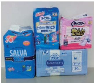
寄付の受け入れも受付しています (新品未開封に限ります)

〔配布人数〕 おむつ5名・パッド5名 〔応募先〕 〒278-0003 野田市鶴奉5-1 野田市社会福祉協議会 〔応募締切〕 3月31日（水）