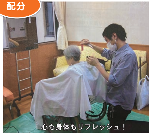
心も身体もリフレッシュ!