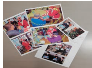
たくさんのお礼のお手紙や写真

また、毎年のプレゼントも「利用者さんが喜ぶように」と工夫がされています。地域福祉は、社会全体で課題解決に向けて取り組んでいく必要があります。企業の協力も不可欠です。今後、活動がさらに期待されます。