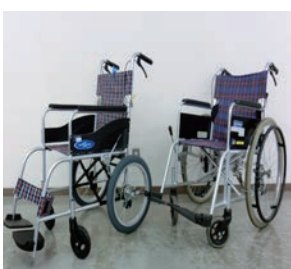
貸出状況はお問合せを