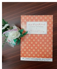
あなたの思いを書き留めておくために