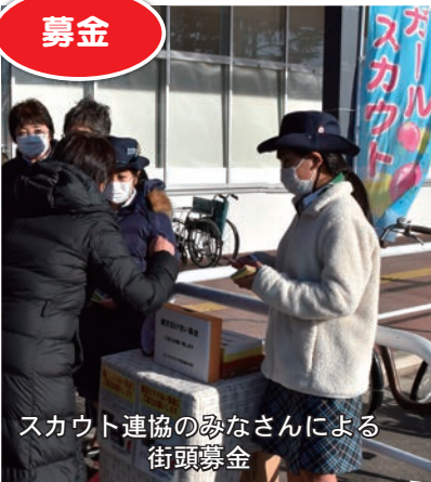
スカウト連協のみなさんによる街頭募金

12月の1か月間「歳末たすけあい運動」を実施したところ、市民のみなさまからの温かいご協力をいただき、ありがとうございます。厳しい経済状況の中、歳末たすけあい募金の総額は、271万7千697円となりました。(令和3年1月末現在) あらためて、お礼申し上げます。 お寄せいただいた募金は、準要保護世帯などの支援を必要とする方々(231世帯・637人)に「歳末見舞」として、街の活性化にもつながるよう市内共通商品券(NOX)を配布しました。 また、70歳以上のひとり暮らしで、要介護1以上の方へ「エアコン・クーリングサービス」も継続実施しており、合計17世帯にサービスを行いました。