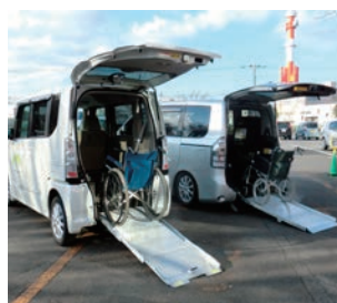
運転手は利用される方で確保をお願いします