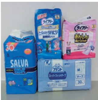
寄付の受け入れも受付しています (新品未開封に限ります)