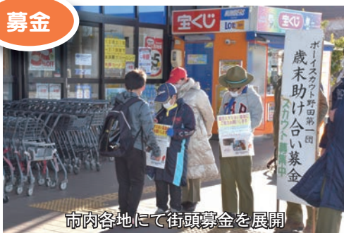
市内各地にて街頭募金を展開