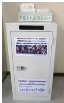
リサイクルで社会貢献も