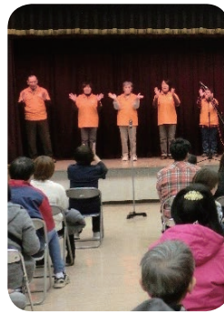
開会式では 手話コーラスを披露