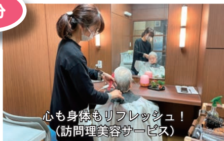
心も身体もリフレッシュ！ (訪問理美容サービス)

グサービス」の事業費として配分されます。 市内各地で、街頭募金活動も行われる予定です。みなさまのご協力をお願いします。