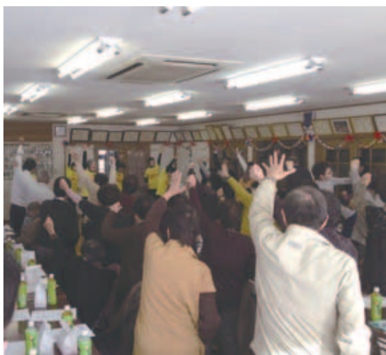
住民参加による福祉のまちづくりを推進 (地区社会福祉協議会活動)

社協では主に各種福祉サービスや相談活動、ボランティアの支援など、地域の特性に応じた活動を様々な場面で展開し、地域の福祉増進に取り組んでいます。