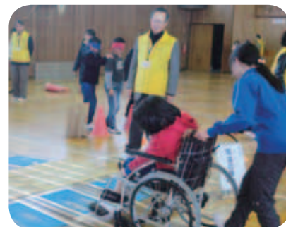
車椅子・目隠し歩行体験学習支援の様子