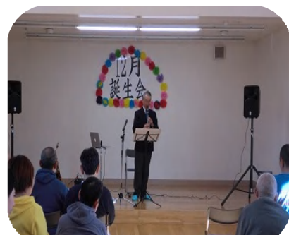
サクソでクリスマスメドレーを演奏中

演奏後、「現役を引退して練習を続けても、披露する機会がないのは寂しいのです。聴いてもらえて音楽は完了と思っています。音楽を聴いてもらえて演奏する場があり幸せです。体力の続く限り無理なく活動していきます」という力強いお言葉をいただきました。ボランティアセンターもこうしたボランティアの皆さんをしっかり後押ししていきたいですね。