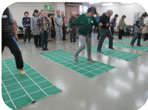
スクエアステップは頭にも身体にも効果抜群！