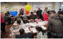
クラフト等の体験でにぎわう室内