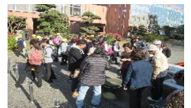
昔の遊びの体験コーナーも人気