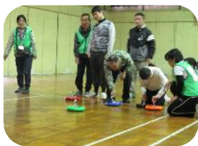
熱心にカラーリングに取り組む参加者♪

恒例の「秋のじょいんと」をNPO法人野田レクリエーション協会の方々と20名のボランティアの方々のご協力のもと、野田市勤労青少年ホームの体育室で実施しました。今年は直前にお申込みのあった1名を含めて、6名の学生ボランティアの方々にもお手伝いいただいて大いに盛り上がりました。知的障がいのある皆さんとボランティアがペアになり、よさこいソーランや大玉ころがしなどで身体をうごかし、心も体もあたたまりました。ポッチャやスカットボール、ラダーゲッターなどはゲーム感覚で楽しくて、何度も本気になって挑戦する姿がみられました。