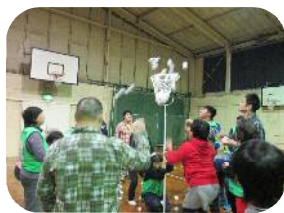
白熱する玉入れで盛り上がる皆さん！