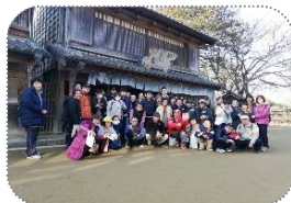
春のじょいんと 房総のむら