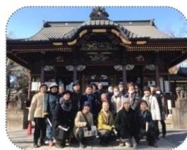
ボランティアサロン 妻沼聖天山

*「じょいんと」とは…知的障がいのある皆さんとボランティア体験のふれあいの集いです