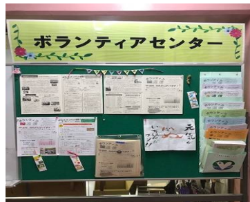
ボランティアセンター入口