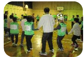
一緒にレクダンスも♪

じょいんとは「野田市手をつなぐ親の会」と共催で年に3回実施している、知的障がいのある方とボランティアの集いです。秋は屋内レクリエーションを行います。知的障がいのある方とペアを組んでいただき、見守りやサポートをお願いします。一緒に軽スポーツを楽しみましょう。きっと素敵な笑顔に出会える1日になりますよ。皆さんの参加をお待ちしています。