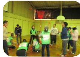
毎年熱戦の玉入れ!