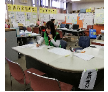
ニーズの受付を担当

まだまだボランティアの力が必要とされている地域もあると思われますが、ボランティアの必要人数や受け入れ側の事情もごさいます。ボランティアに行く前には、情報収集などしっかり準備をしてお出かけください。また、ボランティア活動保険への加入も必要となります。詳しくは下記サイトをご確認ください。