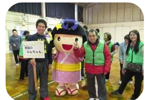
「のんちゃん」の登場に大喜び♪

になったボランティアのやさしい声掛けとレク協の方の的確なサポートでスムーズに進みました。通常のボウリングよりもガーターが少なく、多くのピンが倒れて皆さんで大いに盛り上がりました。自由遊びの時間には、野田の「のんちゃん」も登場し、皆さんは大喜び。一緒に記念撮影したり、握手したりで楽しい時間を過ごしました。