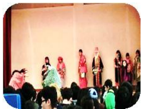
獅子舞と七福人の衣装で

皆さんに笑う事の大切さを伝えたい!!との強い想いで持ち上げられた団体。手作りのお面や衣装でおめでたい七福神踊りや参加型の獅子舞等観て下さる方々が生きる楽しさと元気を取り戻していただくのを目的に施設、病院、自治会、各種イベント等で活動しています。