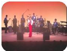
音楽好きのメンバー♪

年若い健康なうちは音楽を続ける、その音楽活動そのものが我々メンバー及び聴いて下さるお客様を幸せにしてくれると信じております。