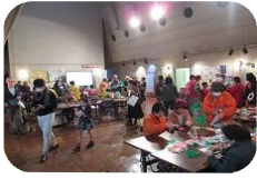
クラフト等の体験でにぎわう室内