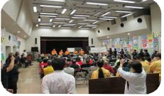
手話コーラスで始まるポスター展の表彰式

天候にも恵まれてお祭り日和の一日となり、この日のために準備してきた27の参加団体の皆さんもニコニコ顔でした。