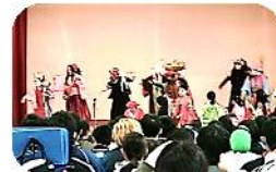
子ども七福神の衣装を着けた生徒さんたち

今年は「爆笑 星の座」に毎年ロータリークラブと合同で行っている「愛のメリークリスマス」に加わっていただきました。当日は笛と共に七福神と獅子舞が登場して踊りを披露。希望する生徒さんの所には、獅子舞が頭を噛み（カミカミ）にまわりました。また、生徒さんにも七福神を体験させてあげたいと子ども用の衣装やお面が用意されており、コスプレを楽しみました。生徒さんたちは初めて見る獅子舞や七福神に興味しんしんで、ちょっぴり恐いけれどもコスプレだけでなく一緒に踊りたいという子もいました。いつか子ども達と一緒に踊れたら、こんなに嬉しく楽しい事はないという「爆笑 星の座」の皆さん。これからも他にはないユニークな個性でイベントを盛り上げ、楽しませて下さい♪