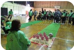
ペットボトルボーリングは大好評

恒例の「秋のじょいんと」を NPO 法人野田レクリエーション協会と21名のボランティアの皆さんのご協力のもと野田市勤労青少年ホーム体育室で実施しました。今回は競技内容を見直し、ペットボトルのボウリングとパン食い競争を取り入れました。ペットボトルのボウリングセットは職員が手作りしてくれたものです。ペットボトルのボウリングは初めての試みなのでどうなるのか心配でしたが、ペア