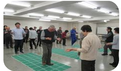
指の運動をしながらのスクエアステップはハードルが高い！

2回目は「フレイルを防止しましょう」と題して、レジスタンストレーニングをご紹介いただきました。つぎ足歩行、つま先かかと上げ運動、立ち座り運動、お尻上げ運動など運動器具を使わず、自体重でその場でできるものを体験したほか、レジスタンス運動を長く続けるコツもお話していただきました。