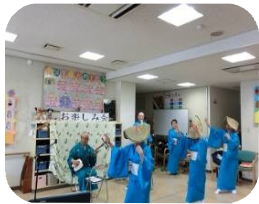
踊りも入って楽しく！

昭和44年に結成された民謡・民舞・銭太鼓のグループ。メンバーの方が、福祉施設で働いていらっしゃるのがきっかけで、7～8年前からボランティアで施設訪問をしています。