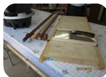
「蕎麦道楽 野田式ハ会」が 購入したそば打ち 道具一式