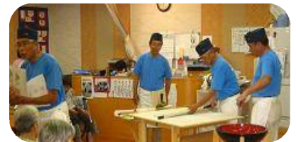
昨年の福祉施設でのそば打ち体験の様子