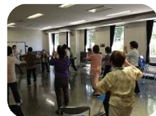
なごみ「和サロン」の様子