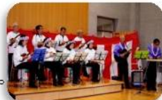
公民館まつりの様子

懐メロやハワイアンと一緒に歌いましょう。ウクレレの演奏と歌による施設訪問をしています。