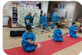
銭太鼓で賑やかに！

メンバーは幸手、五霞、野田と三県にまたがっており、訪問先も三県の施設におよび幅広い活動をされています。