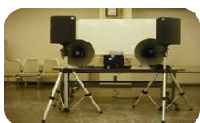
「むぎの会」が 購入した 音響機器

ボランティアセンターでは、社会福祉協議会入り口と市役所の掲示版に助成金情報のコーナーを設けて随時情報を発信しています。みなさん時々チェックして、上手に助成金を活用してください。