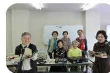
← 購入した機材で 練習中の「表現 グループゆらぎ」 の皆さん