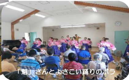
「魁」とよさこい踊りのボラ