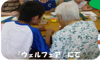
「ウェルフェア」にて