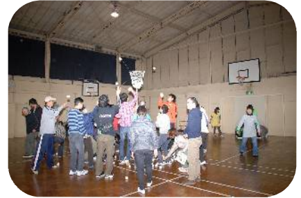
玉入れは毎年盛り上がります♪

*「じょいんと」は「野田市手をつなぐ親の会」と共催で年に3回実施している知的障がい者とボランティアの集いです。