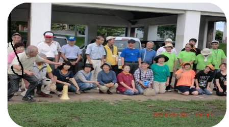
「子どもの未来ネットワーク」の皆さんと