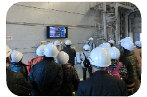
昨年の様子 防災科学研究所見学

個人で活躍されているボランティア同士の交流や情報交換を目的に開催しています。 ボランティアセンターに個人登録されている皆さんと日頃のボランティア活動のお話しをして楽しい一日をすごしたいと思います。