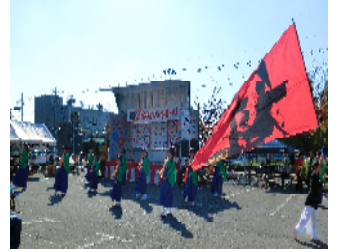
チームの旗も一緒に