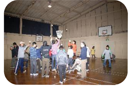
昨年の様子 大人気の玉入れ