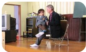
絶妙なAmuちゃんとの掛け合い♪

福祉施設や小学校、学童、幼稚園等で、笑いと喜びを味わってもらうため、腹話術によるボランティア活動を行っている団体で平成元年に結成されました。