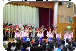
♪ソーランで盛り上がる会場

会場である野田特別支援学校では始まる前から楽しい声聞こえてきます。催しものがはじまると皆さま食い入るようにご覧になられ、天空・魁 sakigakeの南中ソーランやうらじゃ音頭では一緒に盛り上がりました。午後は野田芽吹学園に來訪してレクリエーションを楽しみ、最後は3クラブの方がサンタに扮して会場をわかしました。