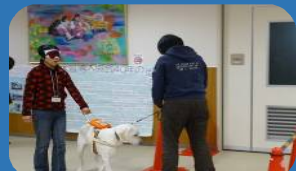
目隠して盲導犬と共に歩く体験中

ボランティアサロンとは…日頃、個人でボランティア活動をされている皆様と情報交換や交流を目的として企画しています。お会いしてお話をする機会が少ないので、センターも皆様にお会いできるボランティアサロンを楽しみにしております。初めて参加された方もいらして今後の活動の手助けになれば幸いです。