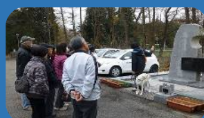
障がい者と盲導犬の絆をイメージした慰霊碑の前で