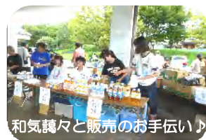
和気藹々と販売のお手伝い♪

今年で15回目を迎えた「遊びの広場」。子どもたち向けの遊びのイベントのお手伝いという気軽さと受け入れ団体である【子どもの未来ネットワーク】のスタッフの皆さんの温かな受け入れ体制で、今年も5人の学生さんが参加し飲み物の販売や物作りのグループのお手伝いを分担し、イベントを大いに盛り上げてくれました。