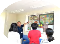
食堂の献立に興味深々！

演奏の後、居室、食堂、作業場等を見学させていただきながら施設の方のお話に耳を傾ける姿は真摯かつ熱心でとてもさわやかでした。