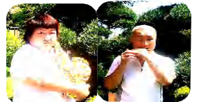
音楽が大好きなお2人♪

音楽がとにかく大好きな年の差夫婦が、演奏活動にお邪魔します！ハーモニカ、サクソ、ピアノ…楽器はこれから増えるかもしれません！施設、病院、学校 etc. どこにでも伺います！（応相談）皆さんで楽しい時を過ごしましょう！