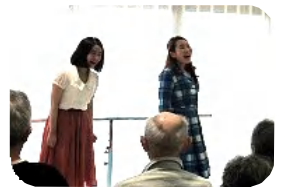
笑顔が素敵なデュオ！

懐かしの童謡・唱歌から最新のミュージカルまでなんでもござれ！リクエストをお待ちしています。