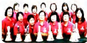
ハンドベルクワイヤ Largo のメンバー

野田市文化祭の参加、施設などへのボランティア活動、Xmas コンサートの開催。皆で一つものを作り上げる楽しさ、喜び、難しさを感じながら、色々なジャンルの曲に挑戦中です。