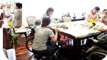
お花の力は絶大ですね！