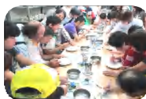
皆でワイワイ楽しく絵付け♪

暑さにも負けず、パーク内のフィールドアスレチックを楽しんだペアあり、道の駅で相談しながらお土産を選んでいるペアあり、ソフトクリームを食べつつ仲睦まじく一息ついているペアもありました。また、「秋のじょいんと」でお会いしたいですね。