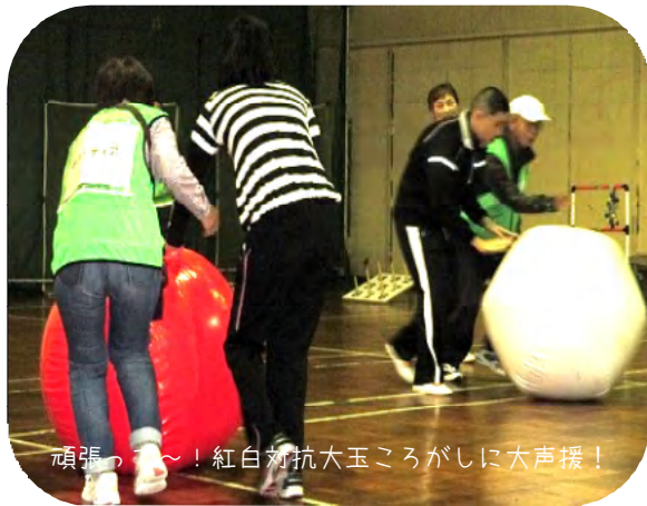
頑張っ～！紅白対抗大玉ころがしに大声援！

じょいんとは「野田市手をつなぐ親の会」と共催で年に3回実施している知的障がいのある方とボランティアの集いです。当日は屋内レクリエーションを行います。知的障がいのある方とペアを組んでいただき、見守りやサポートをお願いします。共に軽スポーツを楽しみましょう。きっと素敵な笑顔に出会える1日になりますよ。皆さんの参加をお待ちしています。