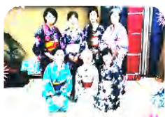
なごみ会のメンバー