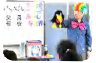
カラフルなカツラが素敵！

今年の夏休みは野田市内 2 か所の学童にも訪問していただきました。腹話術の合間に替え歌を披露して下さり、指にかけるゴムを使ったマジックを教えていただいた後、ゴムをプレゼントされて子ども達は大喜びだったとの事です。これからもどんどん活動の幅を広げてほしいですね。